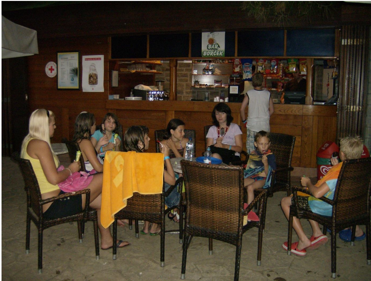
Slika 3: Večerni pogovori in druženje

V nadaljevanju so podrobno predstavljene naše aktivnosti.