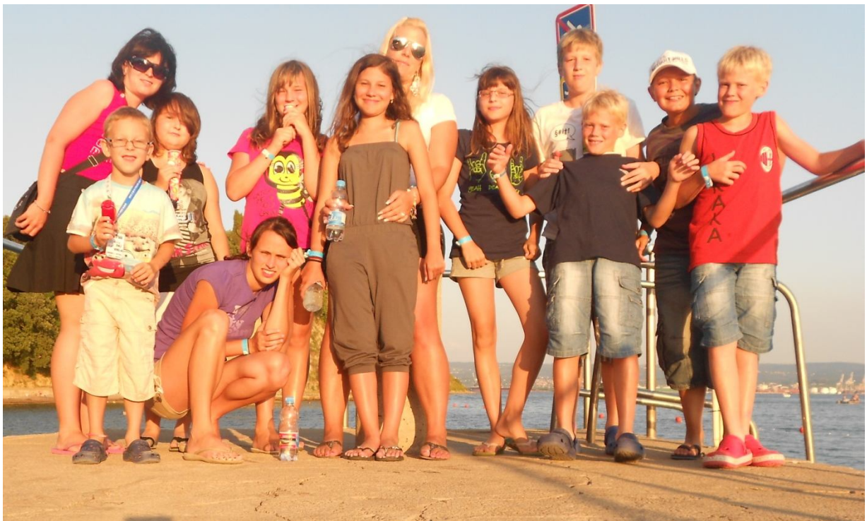
Slika 1: Večerno druženje in sprehodi po obali

Skupina otrok je bila mešana (pet dečkov in štiri deklice), starih od 6 do 14 let. Tekom našega skupnega bivanja smo se izjemno povezali in spletli tesne prijateljske vezi. Otroci so se med seboj odlično ujeli, sodelovali med sabo, si pomagali in skrbeli tudi drug za drugega. Prav tako smo vsi že na samem začetku začutili pripadnost k svoji majhni, a zelo prijetni skupinici in tako postali nerazdružljivi.