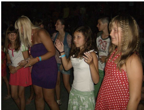
Slika 17: Ples