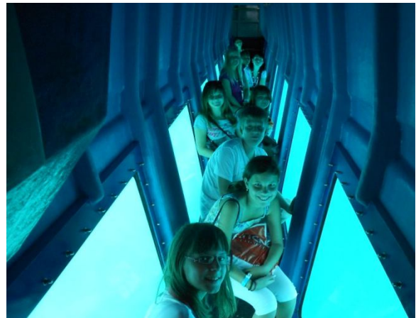
Slika 14: Vožnja z ladjico in občudovanje podmorskega sveta