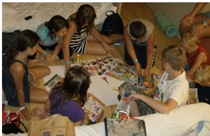
Slika 15: Izdelava prehranske piramide

Zajtrk Igra "skriti prijatelj" - razdelitev pisem Dopoldansko kopanje Delavnice - pogovor o zdravi prehrani ter izdelava prehranske piramide Kosilo Popoldanski počitek Popoldansko kopanje Večerja Družabni večer (sladoled, ples, igre, sprehodi) Priprava na spanje Nočni počitek