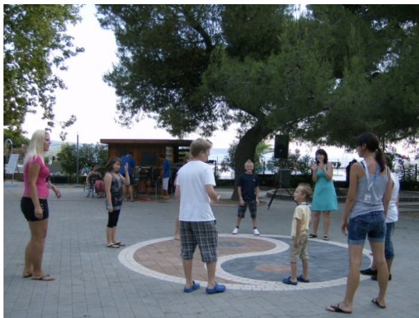
Slika 16: Odbojka v krogu