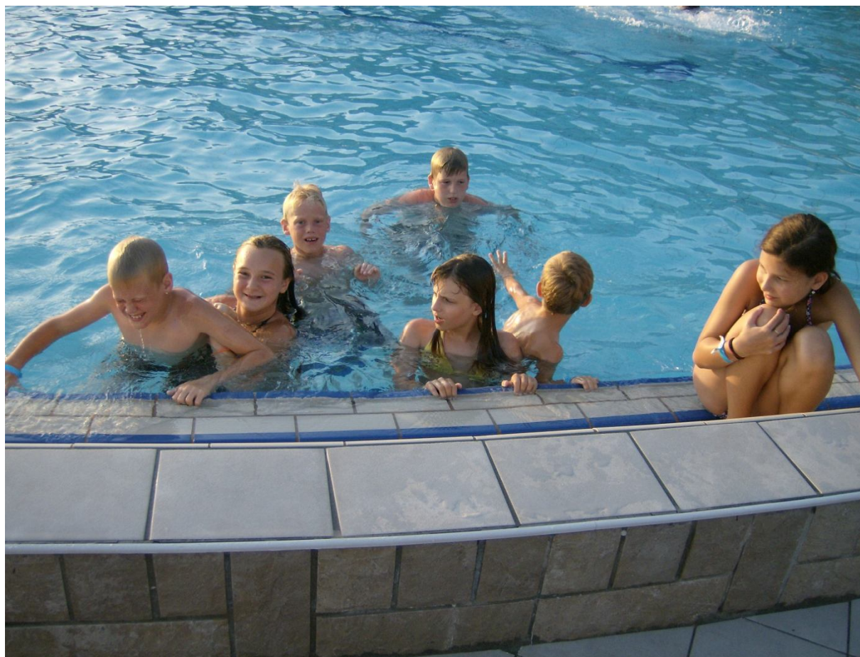
Slika 2: Kapanje

Velik poudarek smo dale na pogovor in reševanje manjših problemov, ki so nastale v posameznih situacijah. Trudili smo se, da smo jih sproti rešili in se pogovorili, da do česa podobnega ne bi več prišlo. Prav tako smo želele otrokom vsako odločitev oz. opozorilo obrazložiti in jim pojasniti zakaj se česa ne sme, oz. zakaj je nekaj dobro, kakšne so posledice in kako lahko to preprečimo.