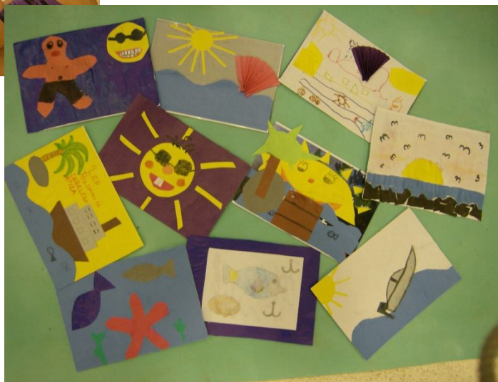
Slika 6: Ustvarjalne delavnice - izdelava razglednic za starše