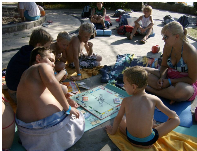
Slika 5: Družabne igre in počitek na plaži