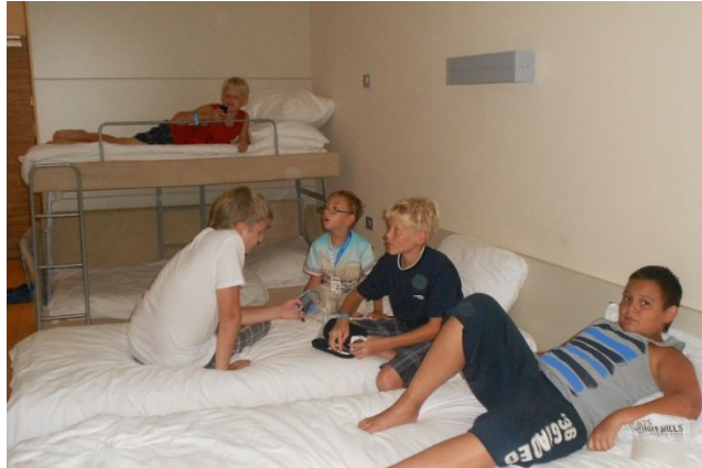
Slika 13: Druženje, igre