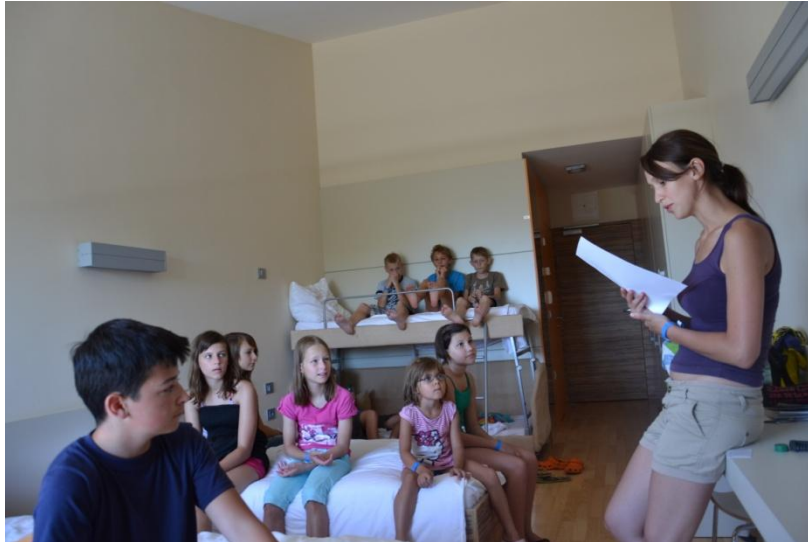
Slika 7 : Delavnica o zdravi prehrani