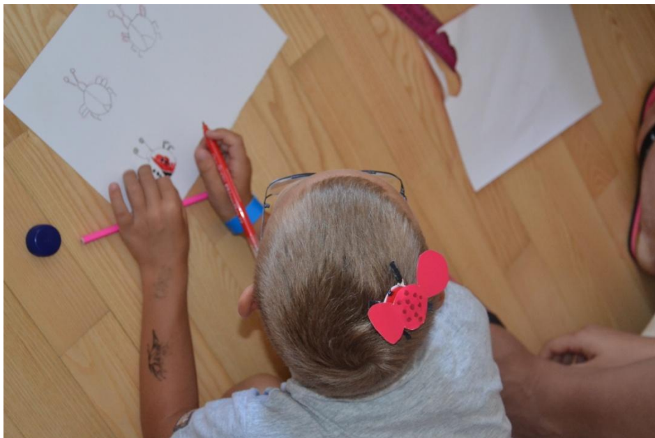
Slika 12 : Izdelovanje pikapolonic iz zamaškov