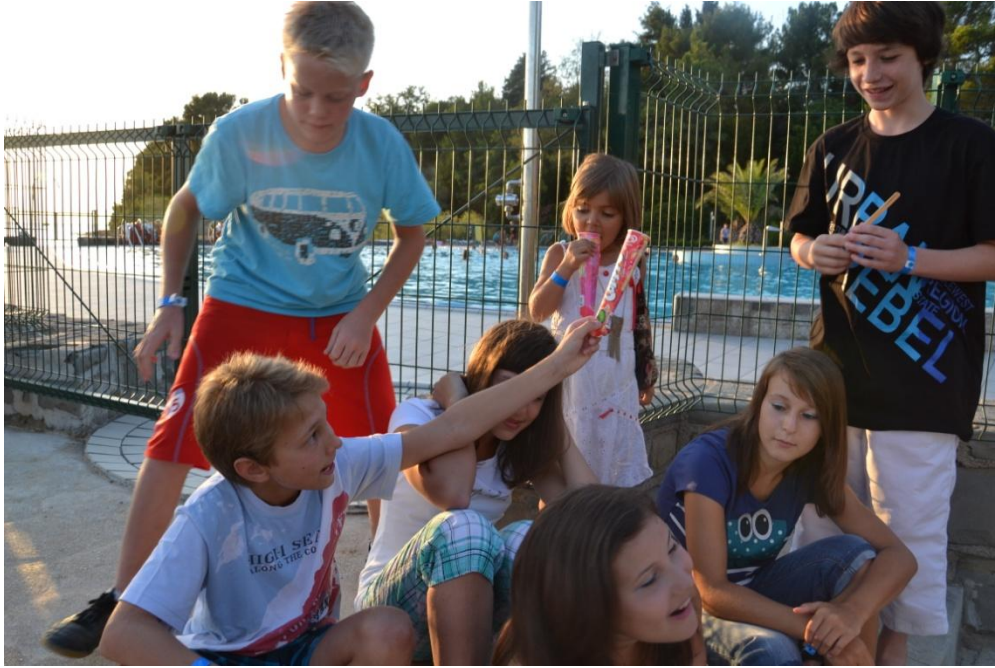
Slika 13 : Večerno druženje