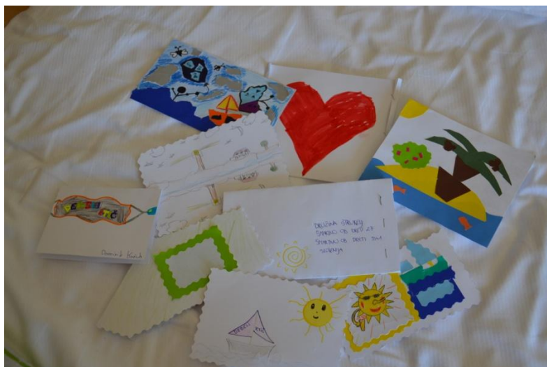
Slika 5 : Razglednice