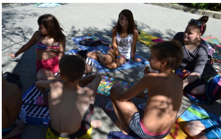
Slika 4 : Druženje na plaži

Bujenje otrok ob 8. uri, nato odhod na zajtrk. Po zajtrku je sledil dopoldanski odhod na plažo. Otroci so se potapljali v bazenu, nekateri so odšli v spremstvu vzgojiteljic zaplavati v morje, spet drugi so kartali na plaži. Vmes je bil čas za dopoldansko malico, kmalu pa tudi čas za odhod v hotel. Prvi dan delavnic smo izdelovali razglednice. Razdelili smo se v dve skupini, vsaka je izdelovala v svoji sobi. Otroci so izdelali čudovite razglednice za svoje bližnje. Ko so bili izdelki končani je sledilo kosilo, nato pa zaslužen popoldanski počitek. Po počitku je sledilo popoldansko kopanje, po kopanju večerja ter večerno druženje ob obveznem sladoledu in dobri glasbi. Prijetno utrujeni smo zakorakali v nočni počitek.