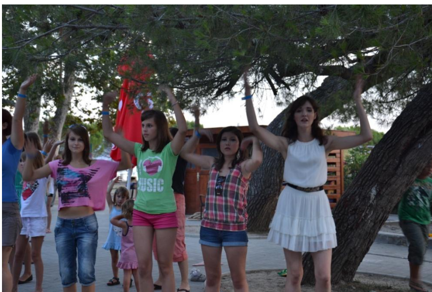
Slika 6 : Ples