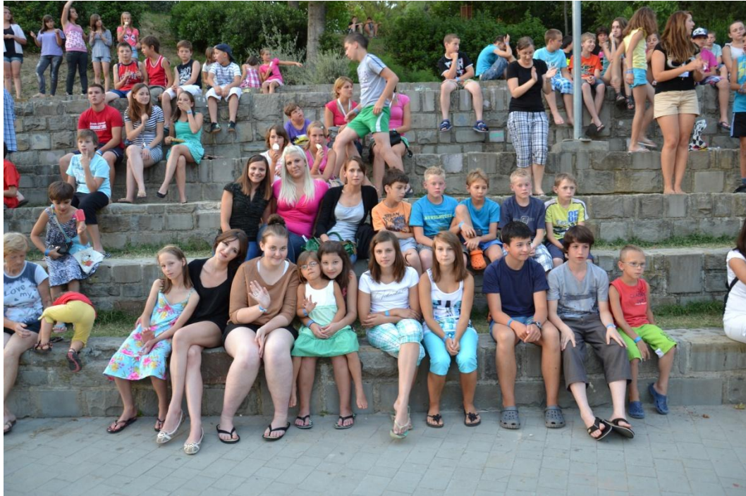
Slika 3: Skupinska fotografija na družabnem večeru