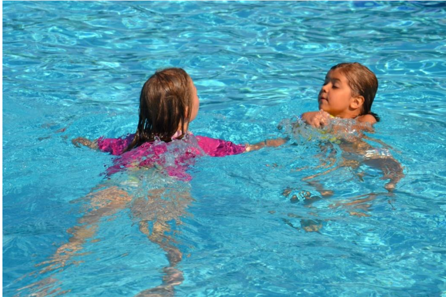
Slika 11 : Uživanje v bazenu