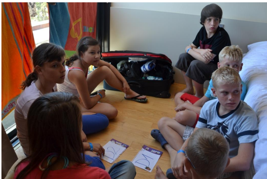
Slika 9 : Kviz o higieni, zdravju, gibanju