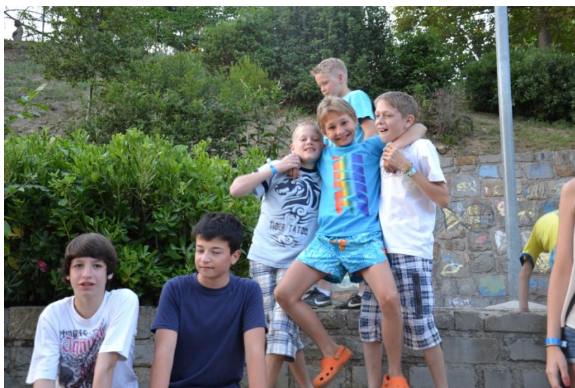
Slika 10 : Večerno druženje