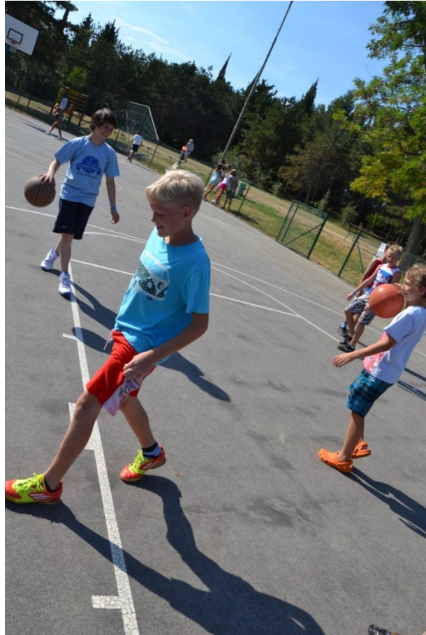
Slika 16 : Fantje na igrišču