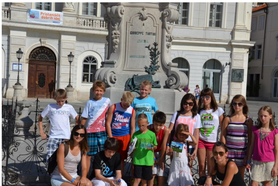
Slika 14 Izlet v Piran