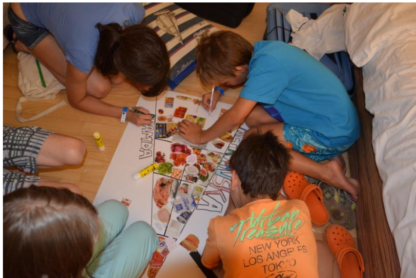
Slika 8 : Izdelovanje prehranske piramide